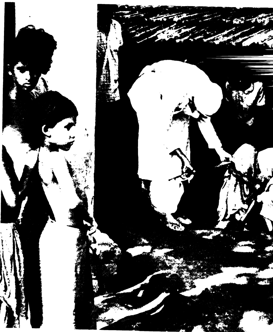
गरीबको निम्ति स्वास्थ्य एवं सफाई सेवा